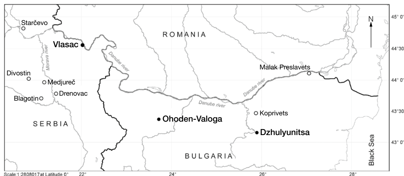
Fig. 1. Research area showing the location of the sites mentioned in the text. ● Sites studied by the authors.

Most of the territory under consideration south of the Sava and the Danube belongs to the Moesian phytogeographical province of the Balkan floristic sub-region, and is dominated by thermophilous mixed deciduous broad leaved forests consisting of oak and beech communities (HORVAT et al. 1974; KOJIĆ et al. 2001; REDŽIĆ et al. 2011). The European Vegetation Map (BOHN et al. 2003) considers the dominant types of oak forests in the area as “Pannonian-Danubian-Balkan lowland to submontane Balkan oak-bitter oak forests” and “Danubian-eastern Balkan lowland-colline mixed downy oak-bitter oak-grey oak forests”. These forests, present around the Danube and the Morava rivers and their tributaries, are dominated by various oak species like Quercus cerris , locally admixed Quercus frainetto , Quercus pubescens etc., as well as ash (e. g. Fraxinus ornus ), hornbeam ( Carpinus orientalis , C. betulus ),